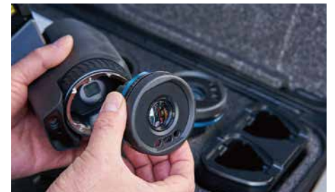
カスタマイズオプション

熱画像上に可視画像の輪郭、文字情報を重ねることにより対象物を把握しやすくする技術です。